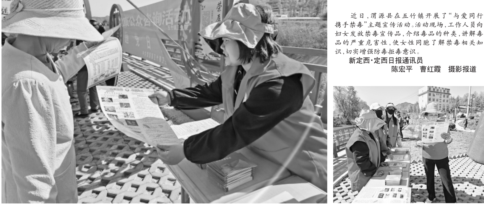
近日,渭源县在五竹镇开展了“与爱同行携手禁毒”主题宣传活动。活动现场,工作人员向妇女发放禁毒宣传品,介绍毒品的种类,讲解毒品的严重危害性,使女性同胞了解禁毒相关知识,切实增强防毒拒毒意识。