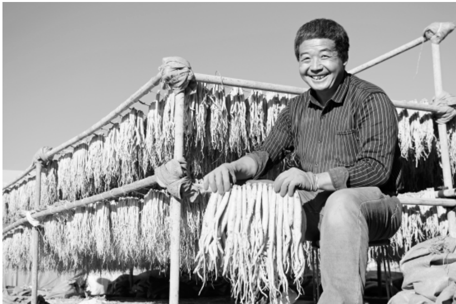
近日，岷县中寨镇农民正在整理晾晒中药材党参。据了解，今年该镇种植的党参喜获丰收，洮河两岸、合作社、晾晒场、农家院落，处处呈现出一派繁忙的丰收景象。