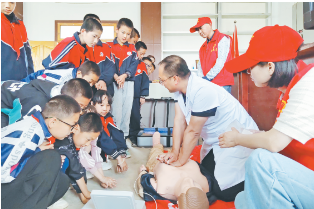
日前，渭源县鸡川镇中心卫生院组织开展急救知识进校园活动，进一步增强了师生应对突发事件和意外伤害的应急意识，取得了积极成效。