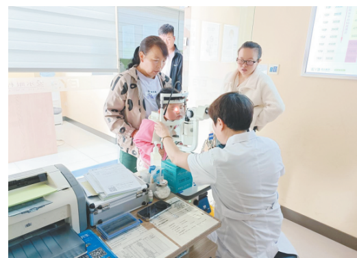
近日，陇西爱尔眼科医院开展“全民爱眼 从我做起”义诊活动。