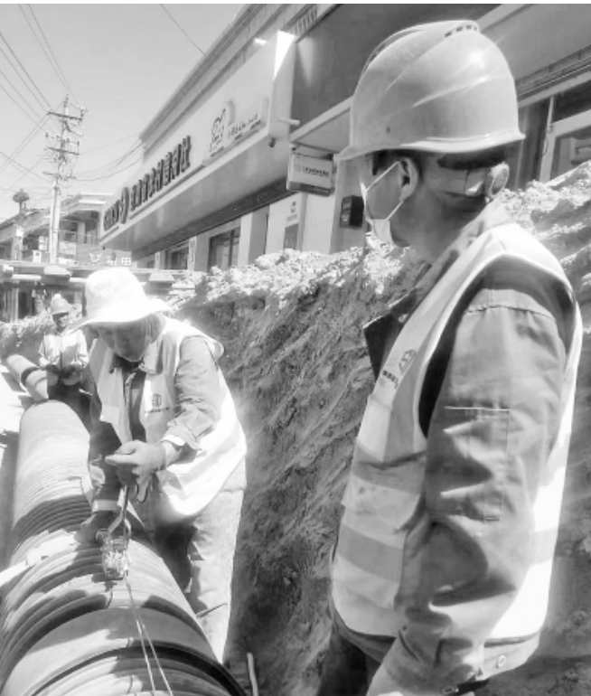
近日,通渭县北城铺镇在北城街道铺设下水管1155米、道牙1200米,安装雨水检查井35座、雨水口55座,拓宽道路600米,彻底解决了街道水路不畅问题。图为街道施工现场。

起来的历史责任。 历史浩荡前行,时代奔腾不息。历经磨难的中国人民,从历史中学到的不是弱肉强食的强盗逻辑,而是更加坚定了走和平发展之路的决心。新时代的中国,在构建人类命运共同体的大道上正与各国携手并肩,将会为变乱交织的世界带来更多稳定、温暖和希望,为人类作出新的更大贡献。